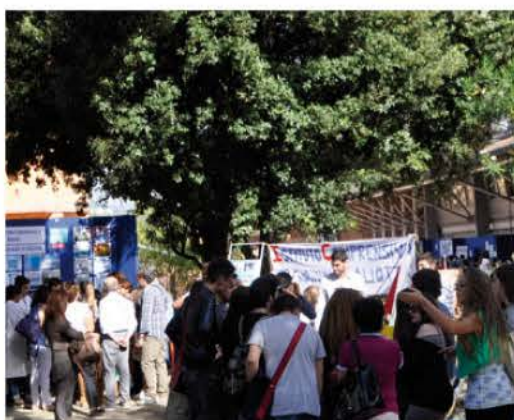
PIC NIC DELLA SCIENZA E DELLA TECNOLOGIA