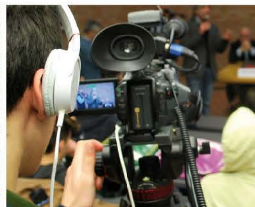
LA PAROLA ALLE SCUOLE