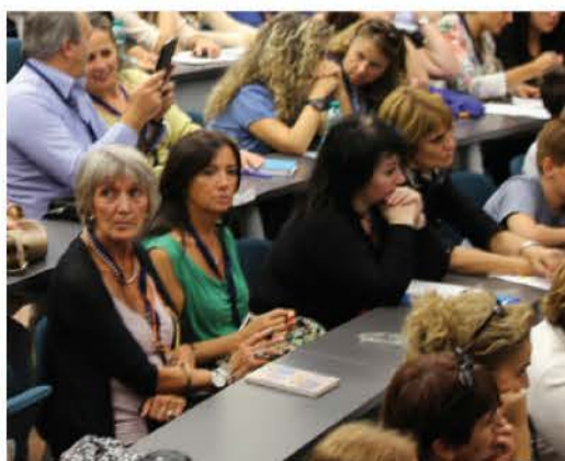
CONFERENZE, CONVEGNI, SEMINARI E WORKSHOP