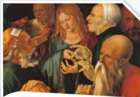
A. Dürer, La disputa di Gesù nel tempio, 1506

Non è forse anch'essa un grande contenitore dove si formano le persone mescolando insegnamenti, idee, discipline, aspettative, sogni, delusioni, successi, lingue e quant'altro?