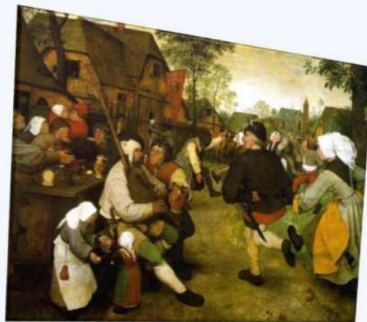
Brueghel, Festa contadina

Non è un grande contenitore in cui si mescolano una complessità di variabili intorno alle persone?