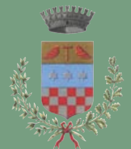
Comune di Usmate Velate