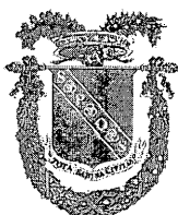
Provincia di Rieti